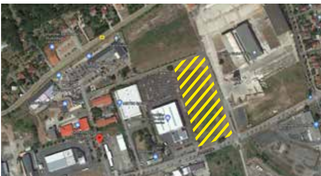
Erweiterung in Rudolstadt – unser neuer Standort in der Titaniastraße.

neuen Büroräumen schaffen wir mehr Funktionalität und Komfort für unsere Mitarbeiter. Auch der Werkstattbereich wurde erweitert. Mit mehr Stellplatz in den Hallen sind nun alle unsere Geräte sicher und witterungsgeschützt untergebracht.