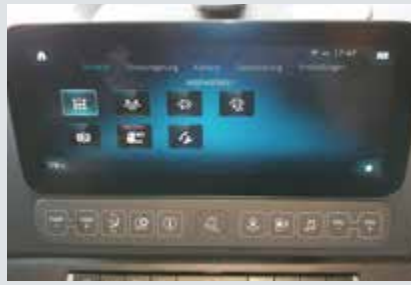
Die zentrale Steuerung wird ganz einfach über die Mittelkonsole bedient.