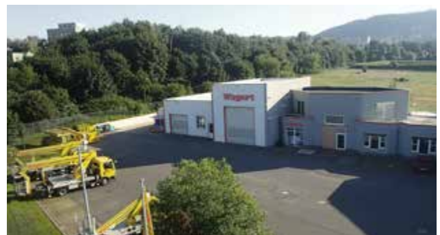
Größer, moderner und flexibler – unser Standort Sonneberg.