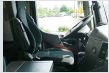
Fahrerhaus XXL: Mit viel (Stau-)Raum, angenehmer Stehhöhe und bequemer Sitztechnik.