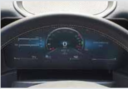
Das Multimedia Cockpit punktet mit integriertem Navigationssystem und Verkehrszeichen-Assistent.