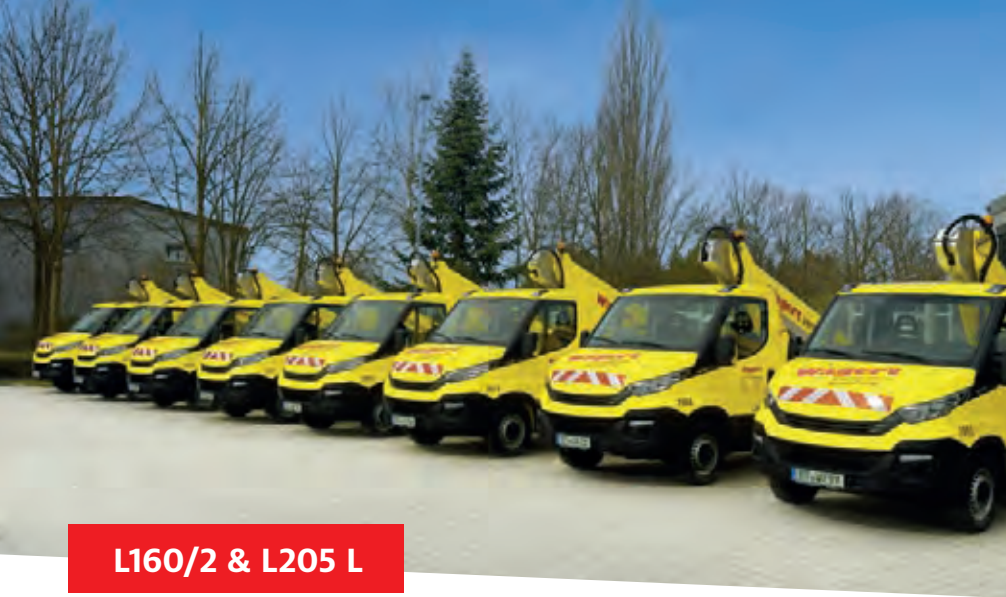
L160/2 & L205 L