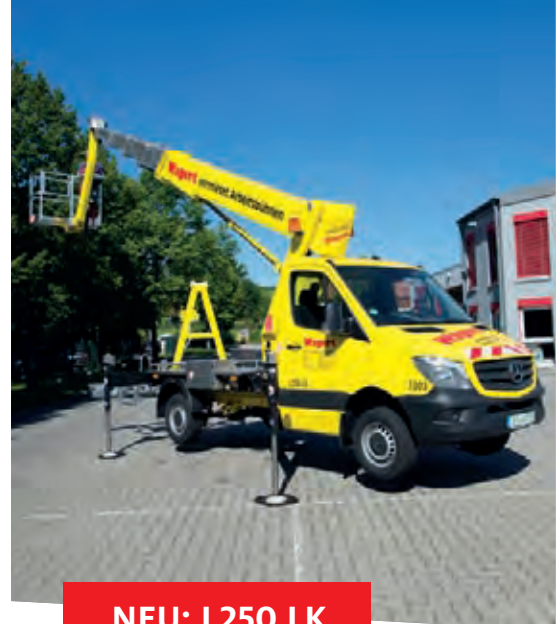
NEU: L250 LK